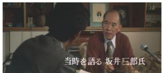
坂井三郎氏。平成 12 年に逝去 84 歳 最終階級 海軍中尉

「坂井三郎。そうだ、お前は大日本帝国海軍の栄えある戦闘機乗りだ。相手が敵機なら存分に戦いしよう。しかし負傷者と女子供の乗っている飛行機は敵ではない。お前は敵を見なかった」