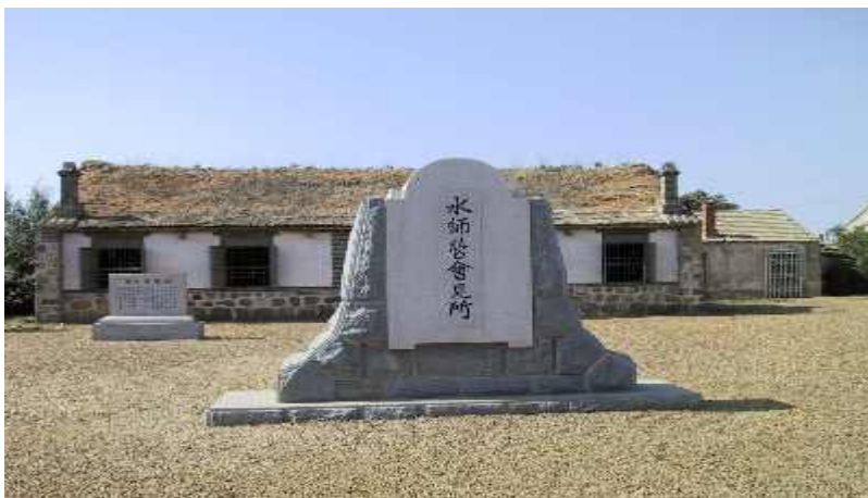
水師營(大連市旅順)

抵抗する力がなくなつた者に対しては、かならず憐れみを加えることは、古来よりの日本の武士道であると共に、今日としては全世界の人類道徳であり、私としては任務として、また、人間と